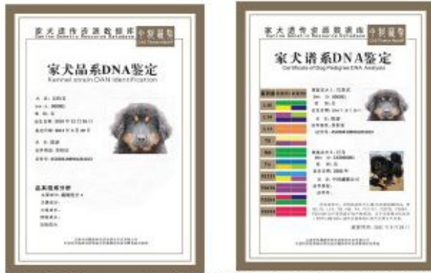
家犬品系和谱系DNA鉴定证书样本

我所和玉龙县雪山藏獒育种有限公司 2010 年携手创建了云南中科藏獒种质资源技术开发有限公司。公司依托我所强大的科技力量，对藏獒进